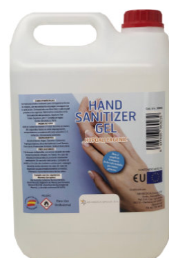
9980082 - GARRAFA GEL HIGIENIZANTE 5 litros

Solución hidroalcohólica transparente para limpieza de manos sin necesidad de agua. Sin aromas. Gracias a sus componentes protege la piel y desinfecta. No reseca