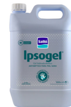
9980093 - DESINFECTANTE ANTISÉPTICO 5 litros