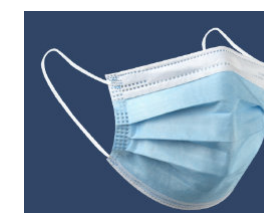
9010386 - QUIRÚRGICA TIPO II R. MATERIAL FILTRANTE 3 CAPAS.

Resistente a salpicaduras. Cumple Norma EN 14638