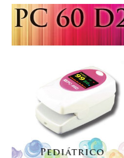
PC 60 D2

AB7800003L- El pulsioxímetro PC-60B1 puede monitorizar saturación oxígeno, pulso, ritmo cardíaco, y índice de perfusión todo ello a través del dedo del paciente. Diseñado para hospitales, domicilio, centro medico, estaciones de esquí, también puede utilizarse antes o después de realizar deporte.