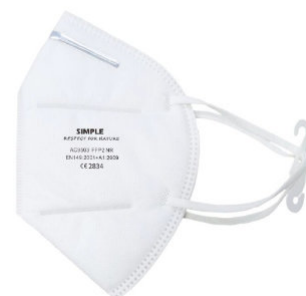
9010387 - FFP2 CE 2834 Cumple regulación EU 2016/425 para EPI