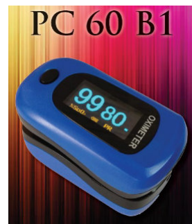
PC 60 B1

AB7800003L- El pulsioxímetro PC-60B1 puede monitorizar saturación oxígeno, pulso, ritmo cardíaco, y índice de perfusión todo ello a través del dedo del paciente. Diseñado para hospitales, domicilio, centro medico, estaciones de esquí, también puede utilizarse antes o después de realizar deporte.