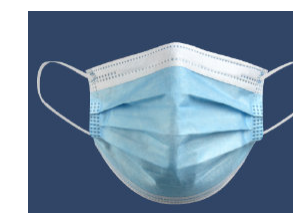
9010391 - QUIRÚRGICA TIPO I. MATERIAL FILTRANTE 3 CAPAS.