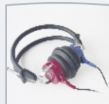
Audífonos TDH 39