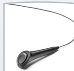
Interruptor de respuesta del paciente