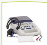
Dispositivo MA 27 completo